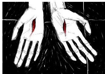
Rys. Marta Sala

Nie bądź niedowiarkiem lecz wierzącym, Pan prawdziwie zmartwychwstał. Alleluja!